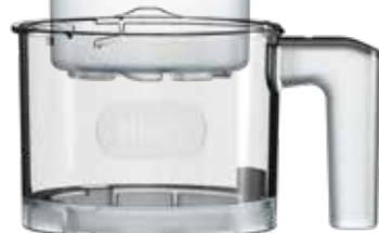
BOL EXTERNE Maintient le pot fermement en place pendant le brassage.

Tous les accessoires illustrés ci-dessus sont lavables au lave-vaisselle.