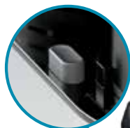
BOUTON DE LIBÉRATION DU BOL

Tous les accessoires illustrés ci-dessus sont lavables au lave-vaisselle.